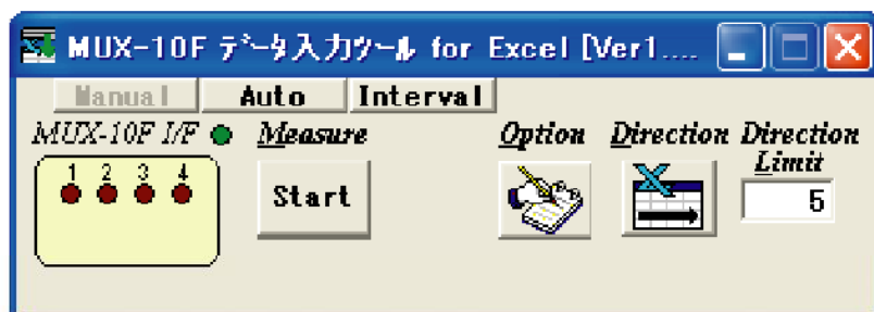
ソフトウェア画面

MUX-10F用 自動データ入力ソフトはミットヨ製マルチプレクサ(MUX-10F)からRS232Cで出力される測定器のデータをMS-EXCELのアクティブセルに転送するソフトウェアです。