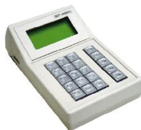
※キーボードタイプ